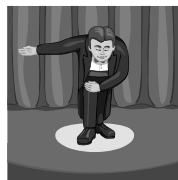
よろしくお祈りします